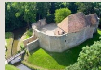
CHÂTEAU DE CRÈVECOEUR