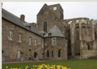
ABBAVE DE HAMBYE